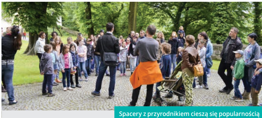
Spacery z przyrodnikiem cieszą się popularnością

M iało jest miejscem do życia dla wielu gatunków ptaków. Niektóre gniazdują w budynkach, inne bytują wśród zieleni miejskiej. Spróbujmy wspólnie wypatrzeć jakie gatunki ptaków można spotkać na Wzgórzu Zamkowym, które jest jedną z „zielonych wysp” miasta. Uwaga! Obowiązują zgłoszenia (liczba miejsc ograniczona): akaleta@zamekcieszyn.pl, tel. +48 33 851 08 21 wew. 35. Zaplanowaliśmy jeszcze jedną turę spaceru na 17 czerwca – niestety ze względu na aurę termin ten może ulec zmianie. Informacje można znaleźć na stronie i fb Zamku Cieszyn: www.zamekcieszyn.pl Spacer jest jednym z wydarzeń towarzyszących wystawie „Miasto i Las”, którą można oglądać w Zamku Cieszyn do 18 czerwca. Ekspozycja opowiada o zwie-