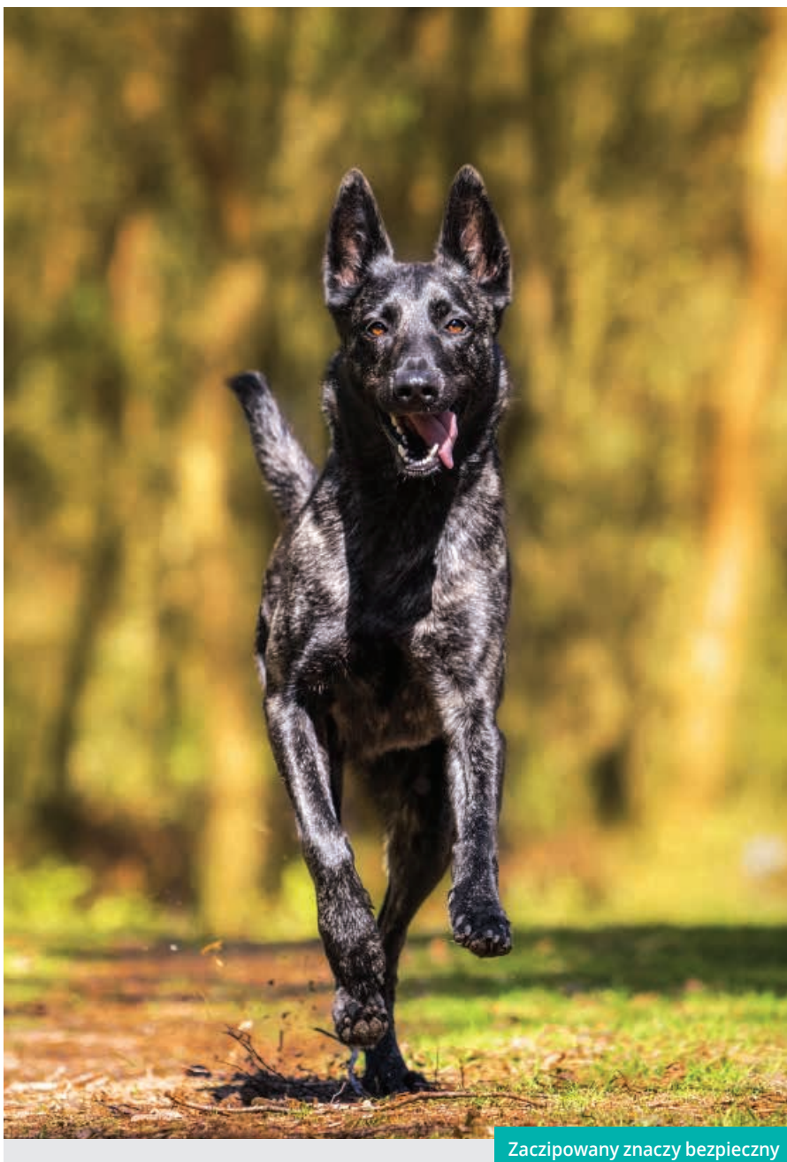
Zaczipowany znaczy bezpieczny

Przypominamy: na terenie Gminy Cieszyn obowiązuje opłata od posiadania psa. Stawka podstawowa od każdego czworonoga wynosi 40 złotych. Uprawnionymi do zniżki w wysokości