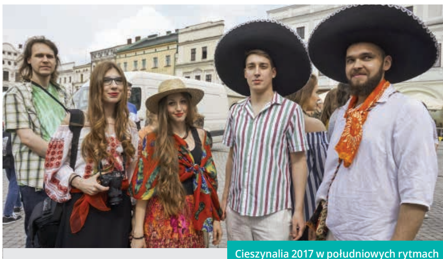
Cieszynalia 2017 w południowych rytmach

Studenci, jak co roku, do wspólnego świętowania zaprosili mieszkańców Cieszyna i gości. ◆