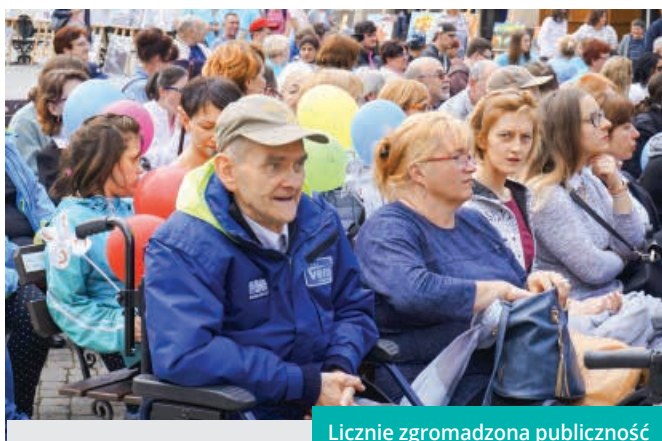
Licznie zgromadzona publiczność

– Nie wyobrażam sobie cieszyńskiego Rynku bez tego wydarzenia – mówił wódcarz miasta, podkreślając radość ze wspólnego spotkania oraz kierując słowa podziękowania w stronę organizatorów, nauczycieli, rodziców i opiekunów – Życzę Wam dużo siły, radości, wytrwałości i satysfakcji, a wszystkim, którzy zebrali się dzisiaj na cieszyńskim Rynku życząc wspaniałej zabawy, uśmiechu i wzajemnej życzliwości. BSK