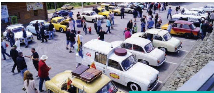
Złot zawsze przyciąga wielu fanów

Śląskie Złoty Syren odbywają się co dwa lata naprzemiennie z Bielskimi Rajdami Syren i są największymi imprezami w Polsce skierowanymi do posiadaczy samochodów marki Syrena, które od kilku lat cieszą się dużym zainteresowaniem nie tylko uczestników-właścicieli, ale również widzów. III Śląski Złot syren będzie okazją do powspominania dziejów świetności „Syrenki” i porozmawiania z ich właścicielami. ORG