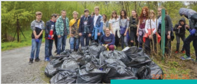
Góra śmieci na Dzień Ziemi

Światowy Dzień Ziemi jest corocznie prowadzoną akcją, której głównym celem jest promowanie postaw proekologicznych wśród społeczeństwa. Najpopularniejszym tematem – bo stanowiącym ogromny problem – poruszonym tego dnia jest zaśmiecanie naszej planety. W tym duchu również w Cieszynie w dniu 25 kwietnia br., po raz drugi zorganizowano Dzień Ziemi, którego motywem przewodnim było „uwolnienie” od śmieci koryta Bobrówki. Akcja „Posprzątajmy Bobrówkę” prowadzona była na odcinku od dawnego młyna przy ul. Frysztańskiej do okolic stacji benzynowej przy ul. Stawowej. Podobnie jak w zeszłorocznej akcji, również w tym roku o oczyszczenie fragmentu naszego Miasta zadbali uczniowie cieszyńskiego Gimnazjum nr 1. Prawie 70 uczniów wyposażonych w dobre chęci oraz worki i rękawice ochronne zebrało ok. 420 kg śmieci. Akcję zorganizował Wydział Ochrony Środowiska i Rolnictwa Urzędu Miejskiego w Cieszynie, a wsparcia udzielił również pracownicy Miejskiego Zarządu Dróg w Cieszynie.