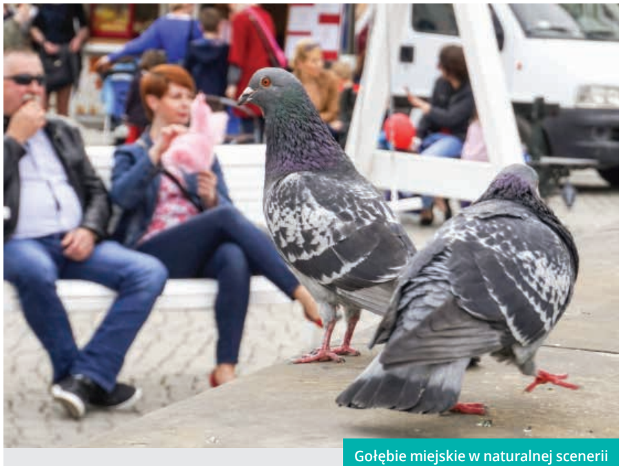
Gołębie miejskie w naturalnej scenarii

Jedną z przyczyn dużej liczebności dzikich zwierząt w mieście jest dostępność po-