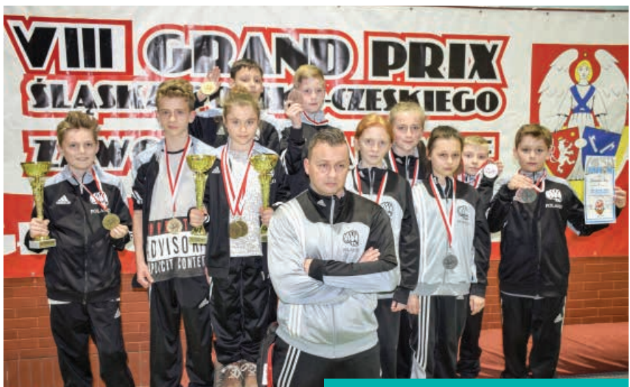
Klub Sportowy Shindo znowu z medalami