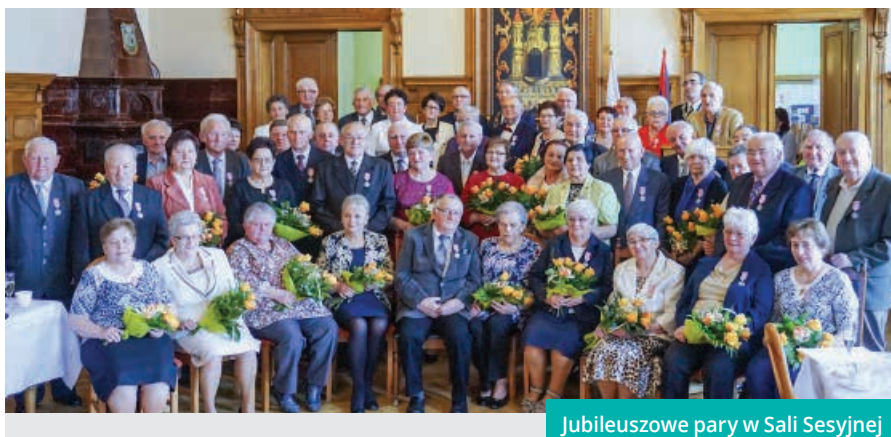
Jubileuszowe pary w Sali Sesyjnej

– Zawierając związek małżeński najczęściej myślimy o wzniosłych chwilach, jednak po nich przychodzi również zwykła codzienność i życie stawia przed nami