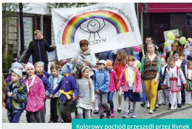
Kolorowy pochód przeszedł przez Rynek