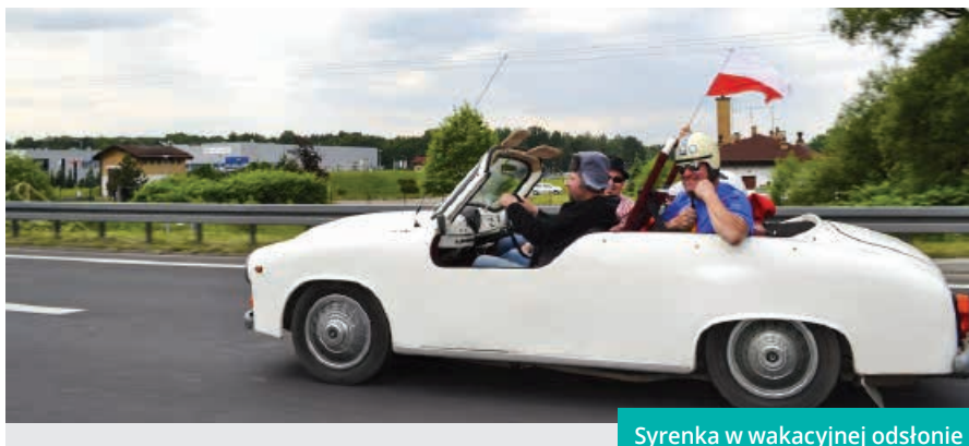
Syrenka w wakacyjnej odświeżce