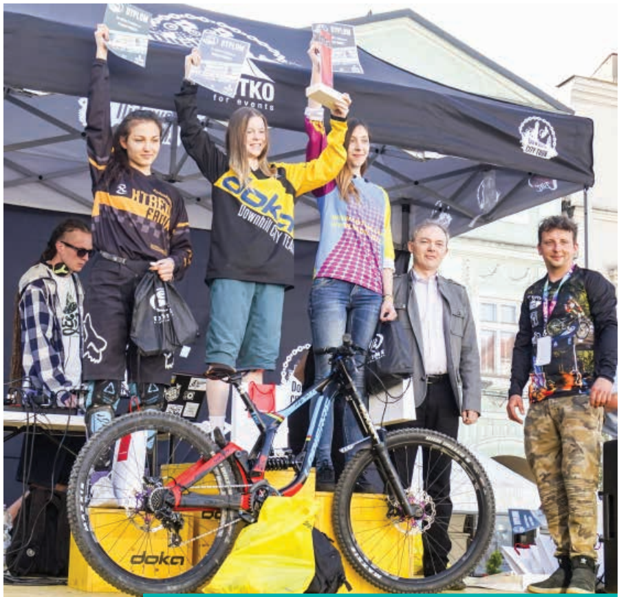
City Tour to ekstremalne wyścigi odbywające się na miejskiej arenie.